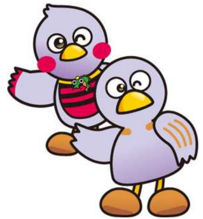
埼玉県マスコット「コバトン&さいたまっち」

埼玉県では以下の大学で 様々な分野の授業を開放 しています。 一般の学生と一緒に学ん でみませんか。